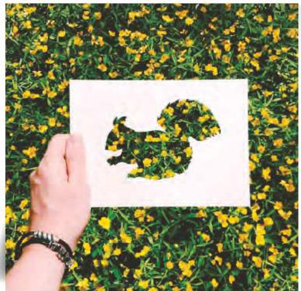
〈니콜라이 톨스티의 작품 예시〉