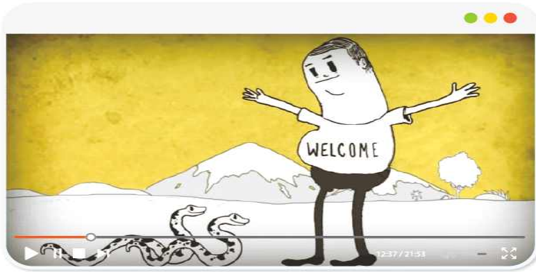
스티브 커츠(Steve Cutts), 「MAN」, 2012